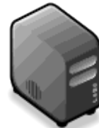
Base d'enregistrement des établissements adhérents